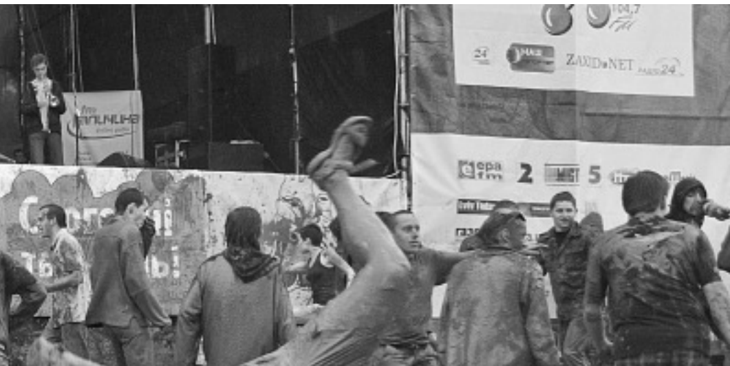
Фото SenYa, Жуковский и Кушнир.