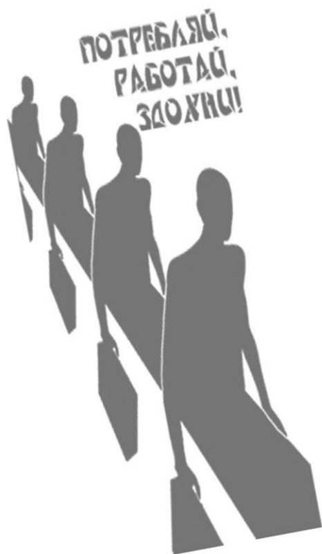
панк-зин "С нуля!" №2

Продавая свое время, продавая время своей жизни, ты, конечно, сможешь выменивать его на бесконечный «прогресс» и моду, выменивать свою жизнь на косметику, тряпки и телефон с видеокамерой. Единственное, чего ты не сможешь купить и вернуть обратно – это время, которое ты УБИЛ на работе, оплачивая все эти капризы общественного мнения.